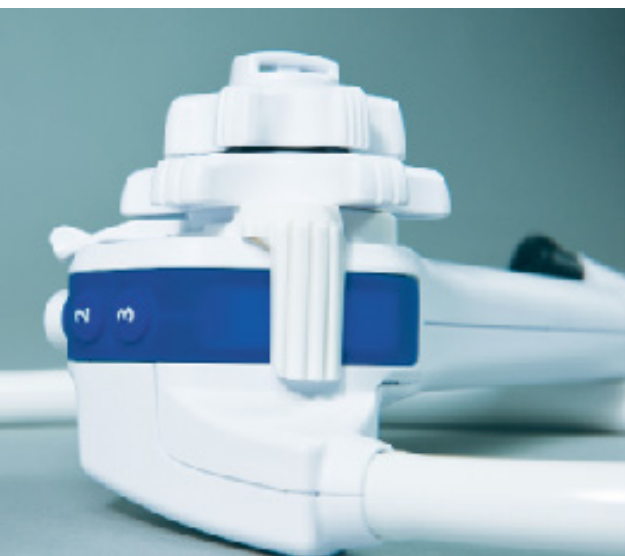
Manette de contrôle