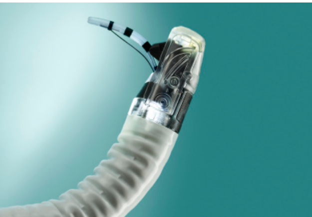
Extrémité distale montrant l'érecteur utilisé avec un sphinctérotome

Avec aScope™ Duodeno, vous disposez d'un nouvel endoscope aux performances fiables à chaque intervention, et sans risque de contamination croisée. De plus, il ne nécessite aucun retraitement, ni réparation ni maintenance.