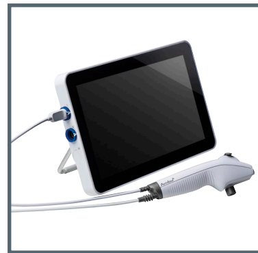
Ambu aScope 4 Broncho Slim et Ambu aView 2 Advance