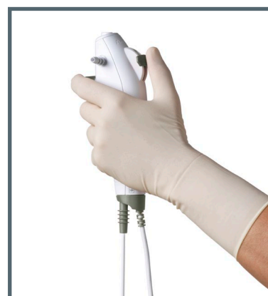
La poignée ergonomique légère est conçue pour vous offrir une prise ferme et confortable