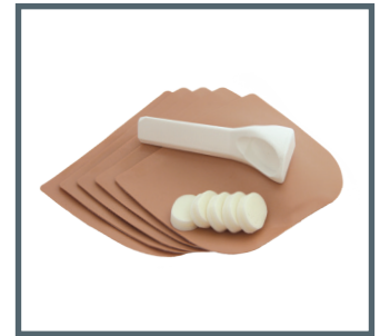
Kit pour injection intra-osseuse