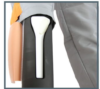
Kit en place sur jambe