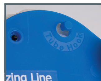
Crochet de fixation de sonde