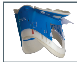
Ambu Redi-ACE Adulte

Manufacturer Ambu A/S DK-2750 Ballerup www.ambu.com