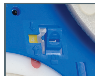
Ergot de verrouillage de taille