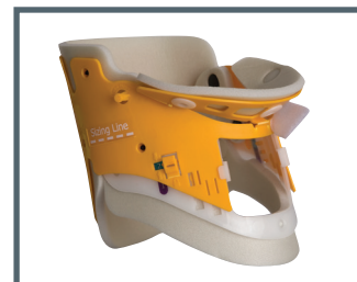
Ambu Redi-ACE Mini