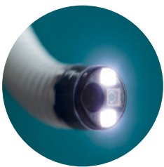
Capteur de caméra HD