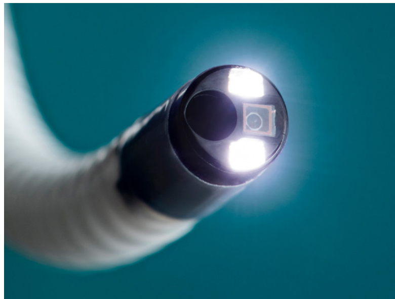
Image claire et lumineuse

Une image endoscopique en direct s'affiche quelques secondes après la connexion de l'aScope 5 Broncho à l'aBox 2. La combinaison d'une puce de caméra haute résolution dans l'aScope 5 Broncho et de l'unité d'affichage et de traitement Ambu Full HD fournit une image supérieure.