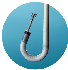
Angles de béquillage (195°/195°)