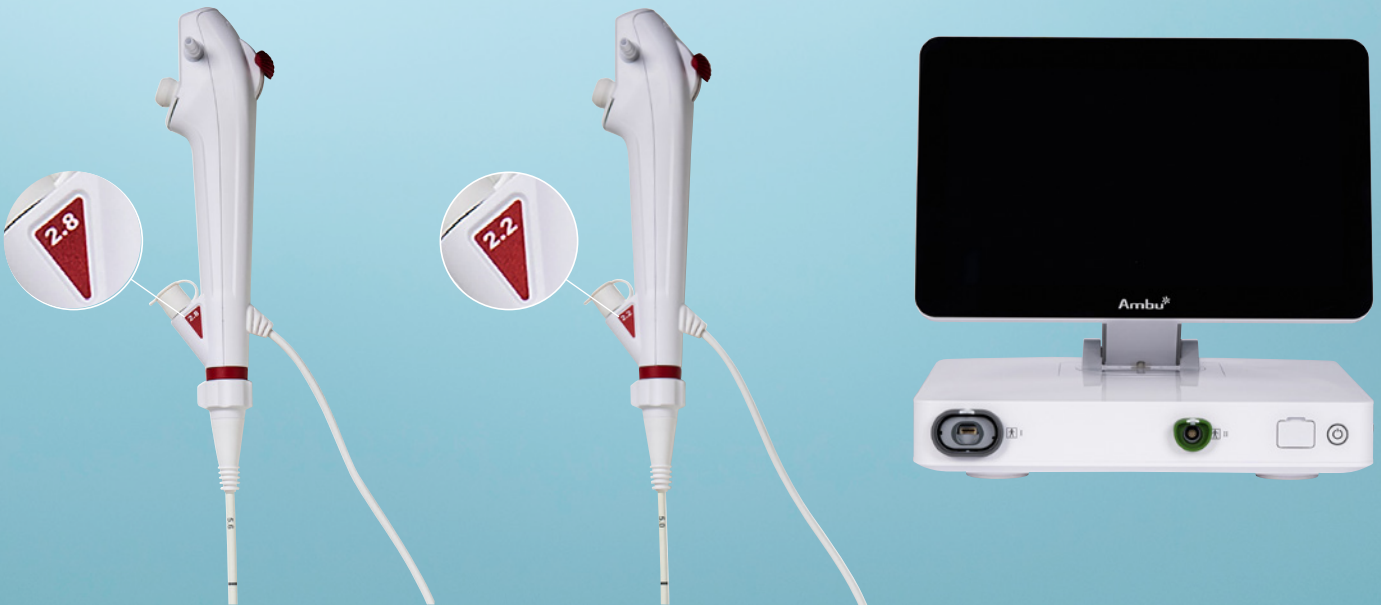
Unité d'affichage et de traitement Ambu® aBox™ 2